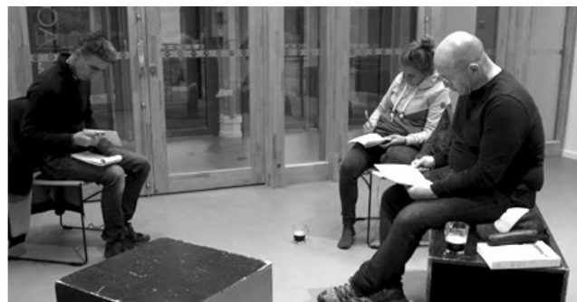
Avant le spectacle à Rochetaillée/Saône, novembre 2023