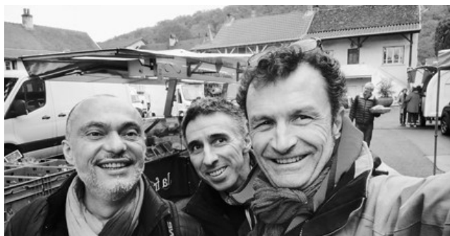
Sur le marché de Lugny, novembre 2022.

à ST-YAN (71), à ROCHETAILEE/SAONE (69), à LUGNY (71), à St-BONNET-DE-MURE (69), à St-MARTIN-EN-HAUT (69), à LYON dans le cadre du dispositif « Nos Cultures de la Ville » dans les quartiers de La DUCHERE, la GUILLOTIERE, VAISE, Les TRABOULES, JEUNET-MENIVAL, SOEUR-JANIN, St-RAMBERT, MERMOZ, PAUL-SANTY, ETATS-UNIS, les PENTES de la CROIX-ROUSSE.